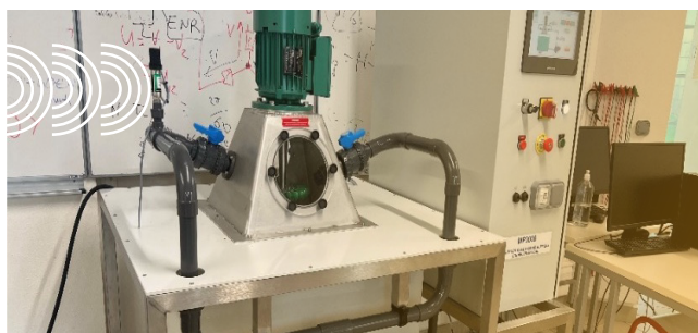
Microcentrale hydroélectrique de l'IUT GON : équipements financés par la taxe d'apprentissage