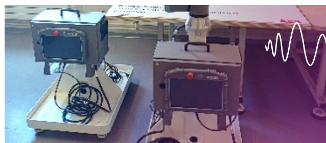
Robots collaboratifs (cobots) de l'IUT GON : équipements financés par la taxe d'apprentissage