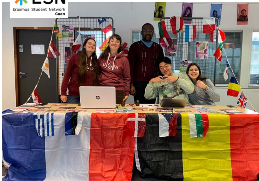
L'équipe ESN Caen