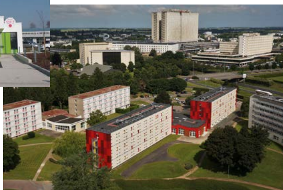
Cité universitaire de Lébisey