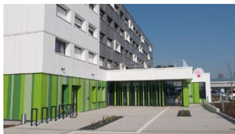
Loge centrale résidence campus 1