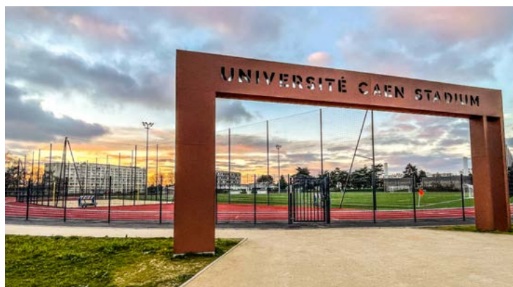
Nouveau stade universitaire - Campus

Important ! À la fin de votre séjour, nous vous conseillons d'attendre deux mois avant de clôturer votre compte bancaire français.