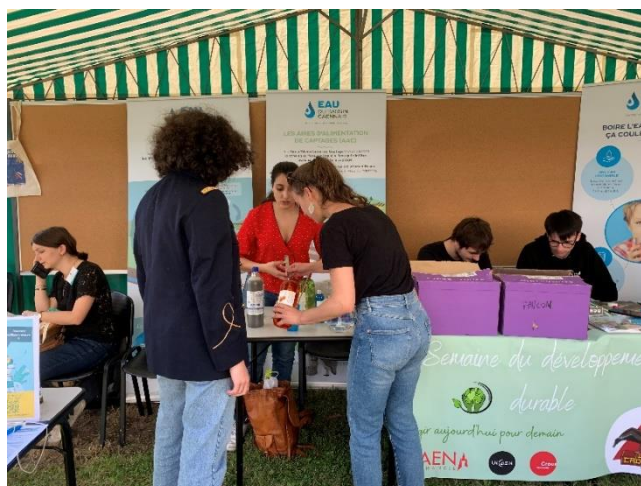
Stand d'information sur l'eau du bassin caennais lors de la semaine du développement durable

Durant toute une semaine de septembre 2021, Lex Cadomus a sensibilisé des centaines d'étudiants aux enjeux du développement durable en mettant en place plusieurs actions : quizz, projection & débat, forum d'acteurs du développement durable à l'occasion des actions de rentrée de l'université, atelier cuisine ou encore gala éco-responsable.