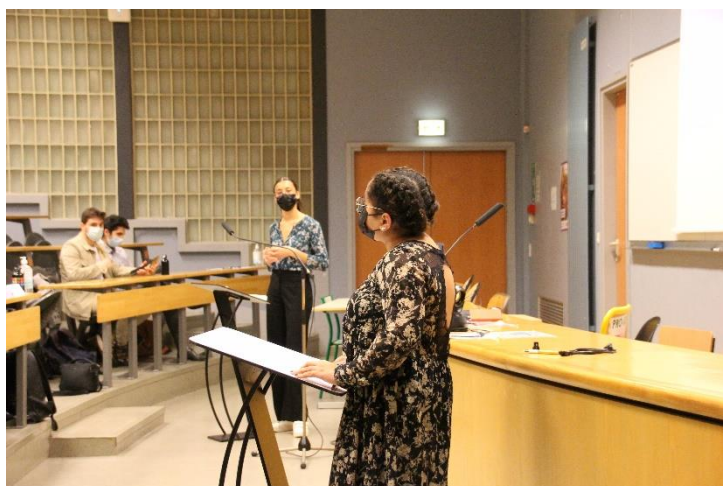
Joute lors du concours d'Elocaence

dizaines de participants pour s'affronter sur une question devant un public et un jury exigeant. Deux par deux, l'un devait défendre l'affirmative à la question posée et l'autre la négative : argumentation structurée, débit, aisance à l'oral, gestuelle et même traits d'humour ont marqué les différentes prestations de nos étudiants, leur permettant de développer des compétences essentielles pour leurs parcours universitaire et professionnel.