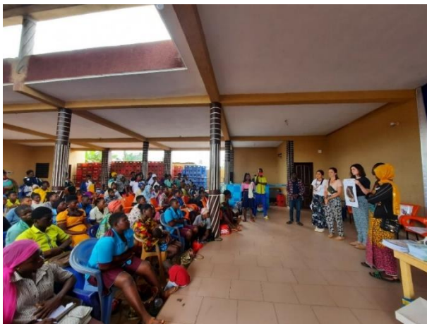
Action de sensibilisation autour de la santé sexuelle au Togo

Le premier projet se décline à travers trois actions dans les villages d'Adétikopé et d'Aveta :