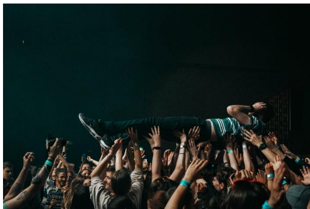
Spidider Led lors de l'un des concerts du festival Les Ondées au Cargö

La journée a été clôturée par plusieurs concerts dans l'enceinte du Cargö.