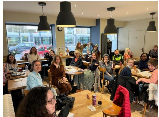
Etudiants en formation accueillis au sein de l'Acadiane lors du Café signes

L'association des étudiants en orthophonie de Caen - ETOCI, en partenariat avec l'association Visuel-LSF Normandie, a permis à des étudiants des différents campus de l'université d'avoir accès à moindre coût à une formation d'initiation à la langue des signes française. Un module de 30 heures a également été réparti tout au long de l'année afin d'apprendre le vocabulaire de base, la grammaire et le fonctionnement de cette langue avec une équipe de formateurs expérimentés.