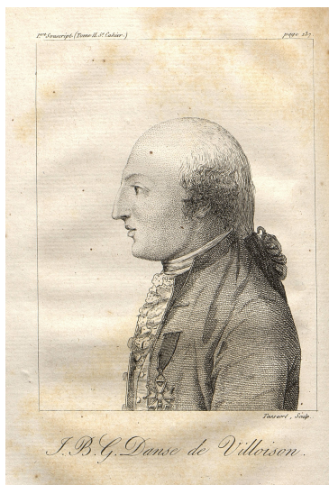
J.B.G. Danse de Villoison