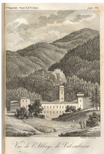
Vue de l'abbaye de Val-ombrosa