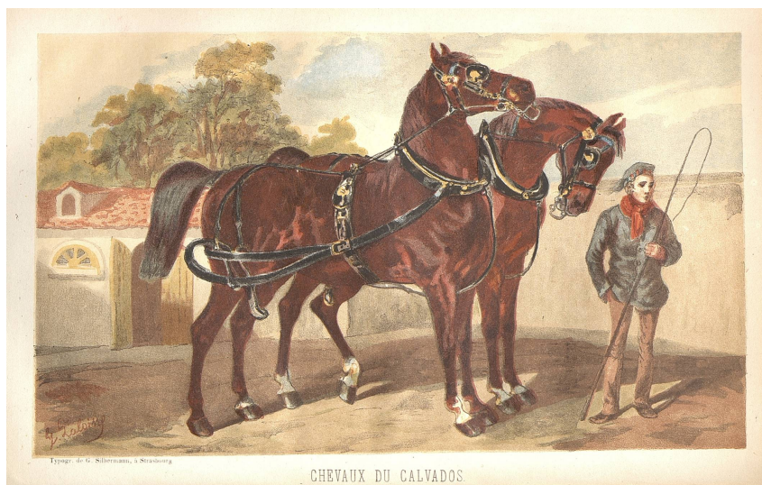
Chevaux du Calvados