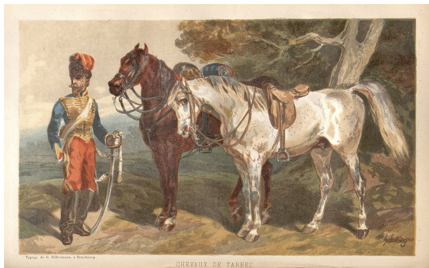
Chevaux de Tarbes