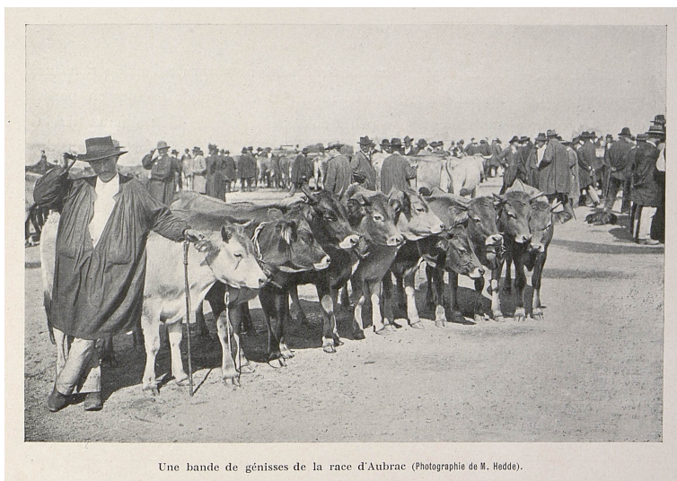
Une bande de génisses de la race d'Aubrac.