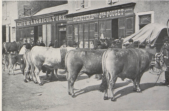
Boeufs gras d'Aubrac à la mi-carême.