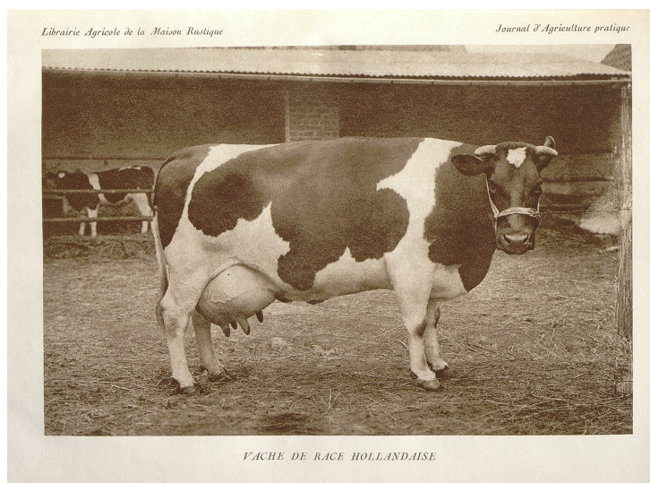
Vache de race hollandaise