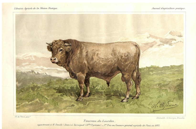
Taureau de Lourdes