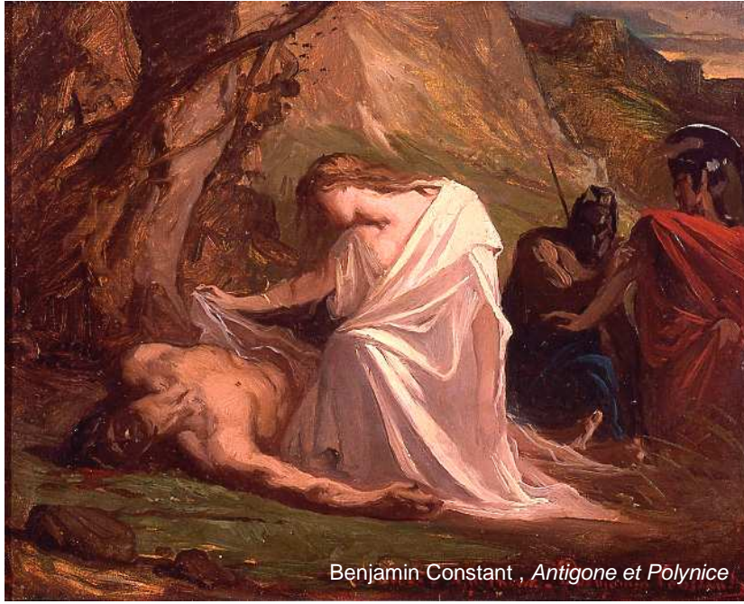
Benjamin Constant, Antigone et Polynice