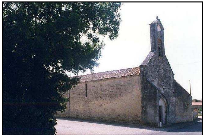
L'église de Notre-Dame de Chambon